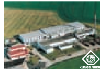
IKS Messerfabrik Geringswalde GmbH, Geringswalde

IKS KLINGELBERG GERINGSWALDE GMBH Production Mittweidaer Straße 44 D-09326 Geringswalde Germany Tel. +49 (0) 37382-846-0 Fax +49 (0) 37382-846-24 E-Mail: iksgw@interknife.com www.interknife.com