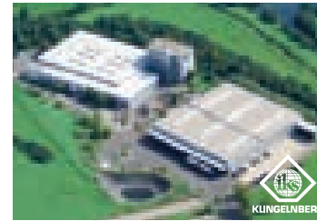
IKS Klingelberg GmbH, Reimscheid

IKS KLINGELBERG GMBH Headquarters & Sales In der Fleute 18 D-42897 Reimscheid Germany T: +49 (0) 2191-969-0 F: +49 (0) 2191-969-111 E-Mail: info@interknife.com www.interknife.com