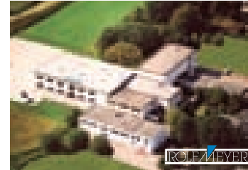
Rolf Meyer GmbH, Bargeheide

ROLF MEYER GMBH Sales & Production Heinrich-Hertz-Straße 17 22941 Bargeheide Germany T: +49 (0) 4532 / 400-0 F: +49 (0) 4532 / 400-200 E-mail: info@rolfmeier.de www.rolfmeier.de